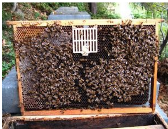
Posizione sul favo